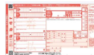
(着払い伝票イメージ)